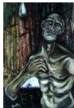
Rys. 4 ironia