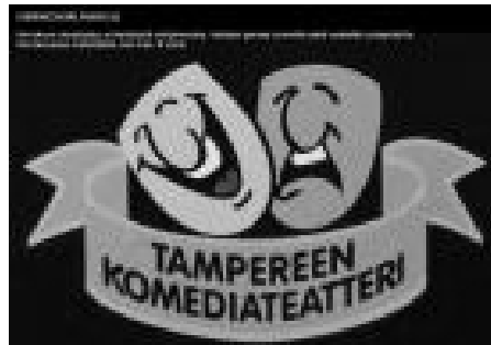
Rys. 2 komizm

Komedia to gatunek dramatu obejmujący utwory operujące środkami komizmu, o żywej akcji i pomyślnym zakończeniu. Powstała w starożytnej Grecji z improwizowanych mimów ludowych oraz pochodów, połączonych ze