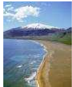
Rys. 5 piękno przyrody

Ta starożytna królowa malowała sobie oczy barwnikiem ze sproszkowanych minerałów. W XVIII chęć stania się pięknym doprowadzała do różnych chorób, a czasem nawet do śmierci, ponieważ do wyrobu różu używano siarkę i rtęć. W XIX wieku kobiety, pragnące być chudsze ścisnęły się gorsetami z fiszbinów i stalowych drutów, co uniemożliwiało całkowite oddychanie. Już starożytni